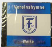
CD - F TSC Vereinshymne